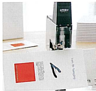
Rygfalshæftning med R106E. Indstilleligt papirstop giver nøjagtig klammeplacering. Hæftning altid med pedal.