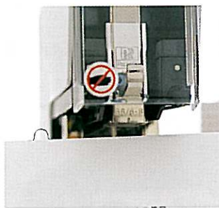
Hæft og "lav huller" samtidig med ringklammer. De får pæne brochurer uden huller, lige til at arkivere.