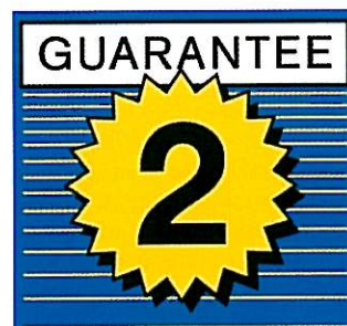
To års garanti dækker materiale og produktionsfejl, forudsat der er anvendt de korrekte hæfteklammer, originale Rapid klammer.