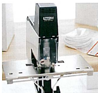
Planhæftning med R106E. Automatisk hæftning eller med fodpedal, hæftedybde op til 100mm.